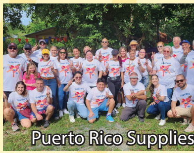
Puerto Rico Supplies